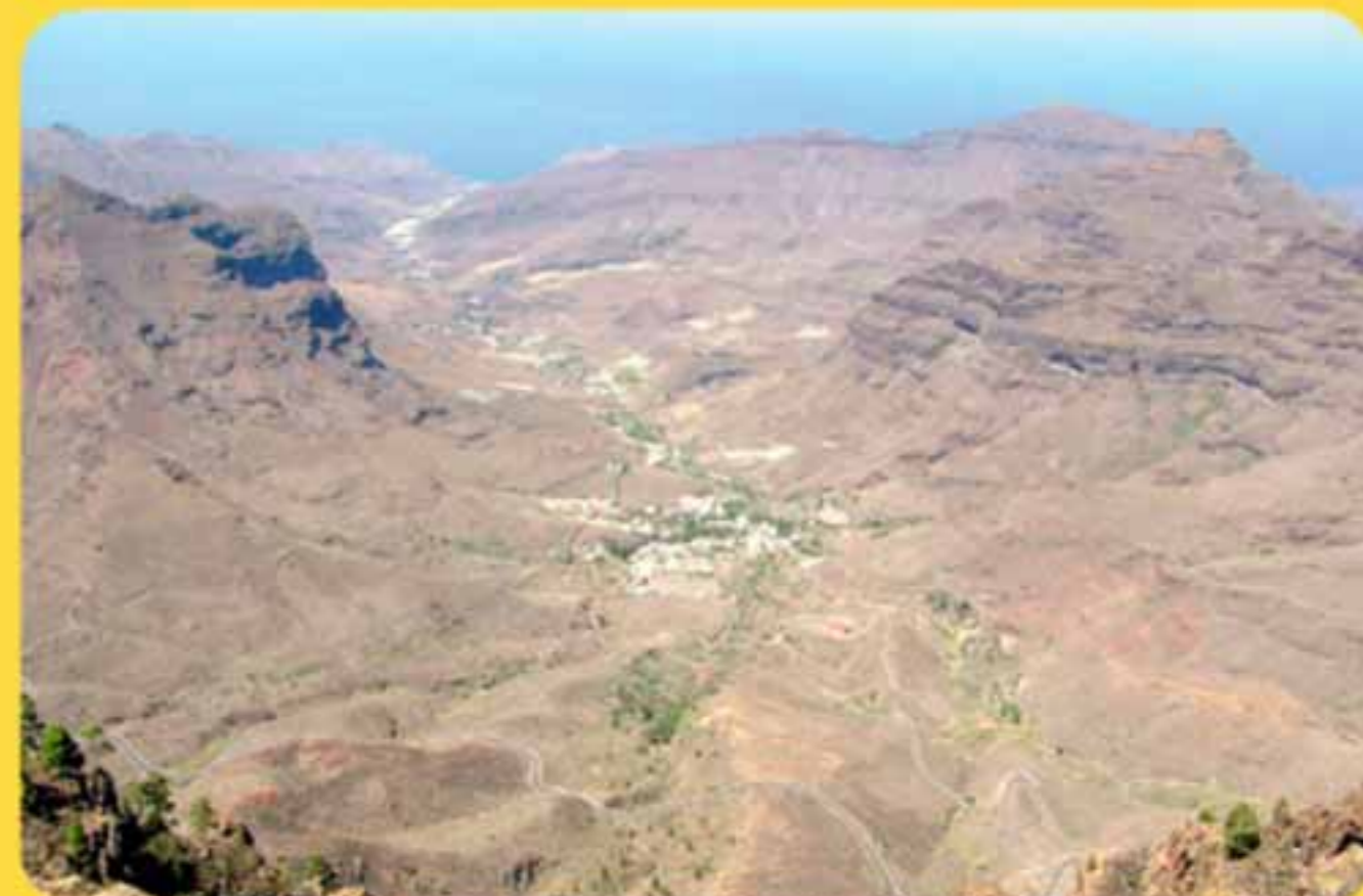
El Valle de Tasarte